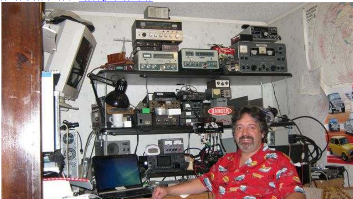
Mike VE9AA activo en Mayo en 6 metros como VO1TTT/M

Estaré con acceso a Internet de forma móvil. 73 de VE9AA/VO1TTT Pueden escribirme a mi correo electrónico a: ve9aa@nbnet.nb.ca