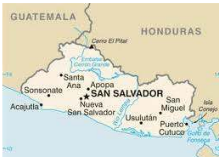
El Salvador YS1/AI5P (6-12 Septiembre 2013)