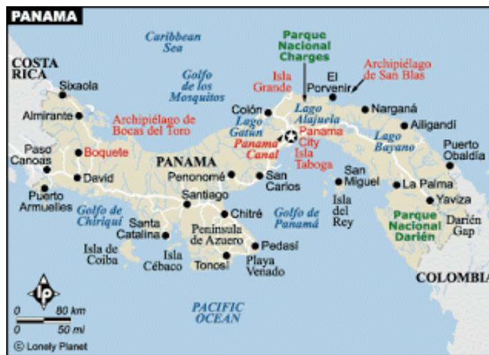
Panamá HP1/AI5P (31 de Agosto al 6 de Septiembre 2013)

HP1/AI5P (31 Agustougust-6 Septiembre), YS1/AI5P (6-12 Septiembre) y YN2PX (12-23 Septiembre). PY1PDF blog.