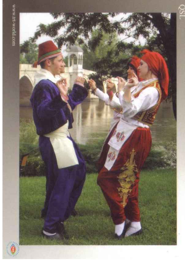
Trakya yöresi halk oyunları, Edirne Thracian region folk dances, Edirne.

Recibida QSL "Thracian Region folk dances - Edirne" por escucha de transmisión en español hacia las Américas en los 9.410 KHz. Recibida en 61 días. Informe enviado vía e-mail a espanol@trt.net.tr (E. Peñailillo, Santiago)