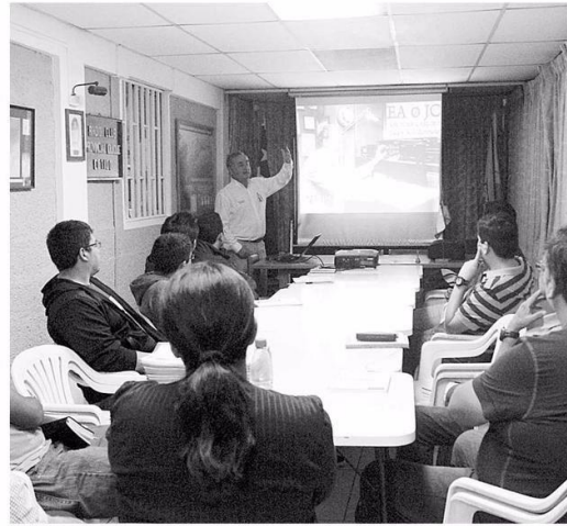
REALIZAN CURSOS POR TRES MESES PARA UNIRSE A LA RADIOAFICIÓN.

"Teníamos un convenio de palabra de muchos años con el diario, pero ahora lo llevamos al papel y, en caso de emergencia, vamos a facilitar nuestras instalaciones para que el diario pueda operar. Nosotros tenemos independencia eléctrica e Internet dedicado exclusivamente a nuestras la-