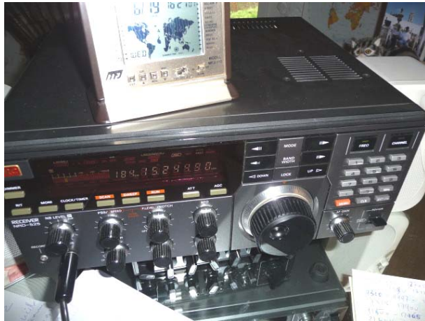
Equipo Japan Radio

6145, KBS World, 1900, Programa en francés con notas sobre literatura española, aniversario del final de la segunda guerra mundial, problemas con Corea del Norte, y notas de fútbol local. SINPO: 44444. Fuente: B. Marthoud, Francia, vía H. Pino, Temuco.