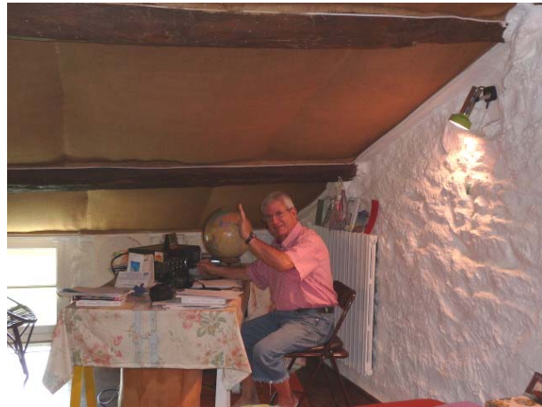
Lugar de escucha de Bernard Marthoud